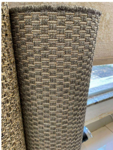
Figura 1 – Padrão de cor - Vulcan

2.1. Tapete São Carlos, coleção New Bouclê, ou equivalente, dimensões especiais de 3,50 m (largura) x 7,50 m (profundidade), composição 100% polipropileno, espessura de 6mm, acabamento debrum, base antideslizante e proteção ultravioleta, cor 95/56 Vulcan – código 01.01.145697. As figuras 1 e 2 demonstram o padrão – cor e textura do tapete, assim como acabamento das extremidades.