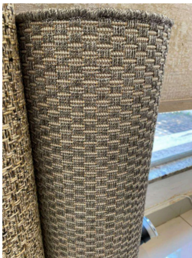
Figura 1 – Padrão de cor - Vulcan

2.1. Marca de referência: Tapete São Carlos, coleção New Bouclê dimensões especiais de 3,50 m (largura) x 7,50 m (profundidade), composição 100% polipropileno, espessura de 6mm, acabamento debrum, base antideslizante e proteção ultravioleta, cor 95/56 Vulcan – código 01.01.145697 ou equivalente. extremidades.